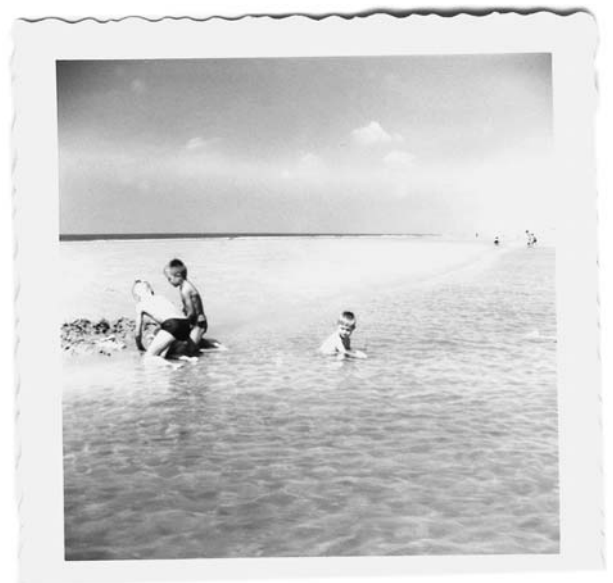
Een drukke stranddag rond 1960