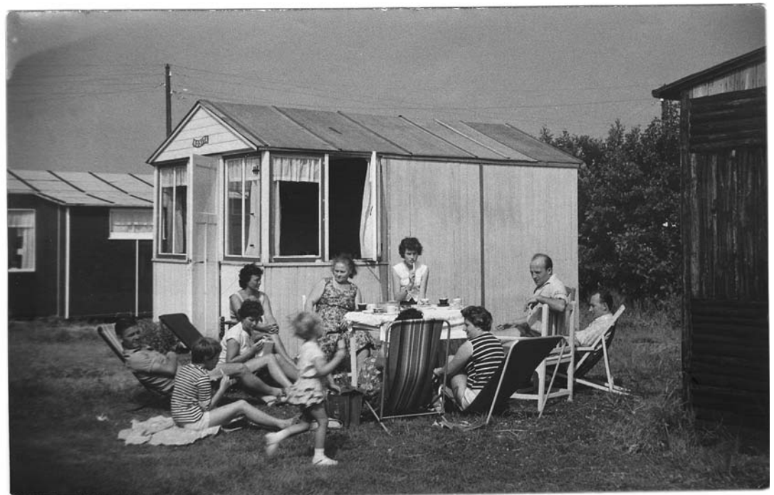
huisje 52 omstreeks 1957