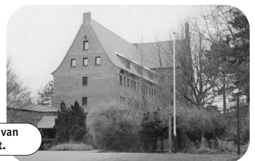
Onlangs werd bekend dat de abdij van Egmond een rijksmonument wordt.

Eigenlijk heb ik iets gemaakt wat ik heel leuk vind, iets nieuws. Eenmalig. Helemaal naar eigen idee.