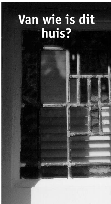
Oplissing huis 28